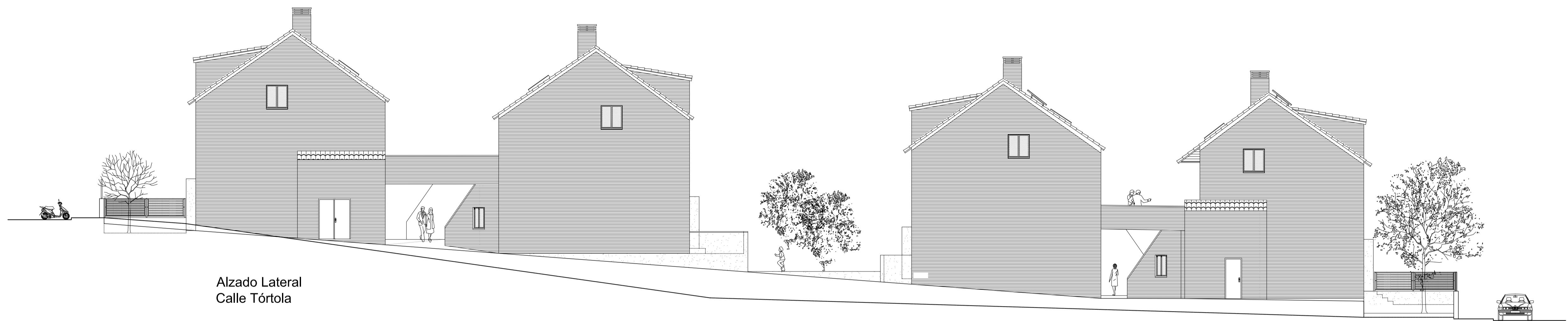
Alzado Lateral Calle Tórtola